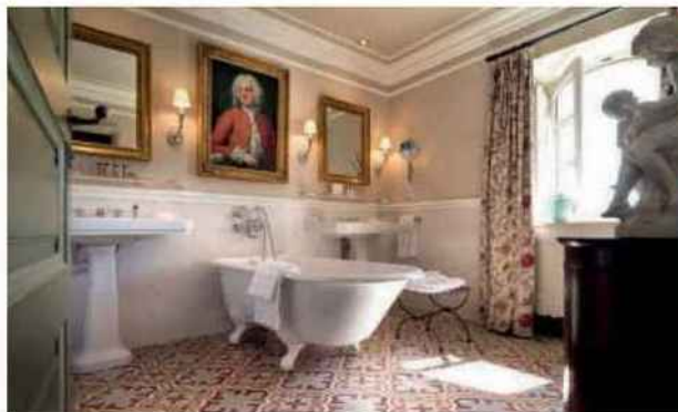
La Bastide de Gordes, dans le Vaucluse.

Où ? Au centre de Gordes, l'un des villages perchés les plus typiques du Vaucluse. Le designer Christophe Tollemer vient de revoir toute la déco et l'agencement des espaces de ce